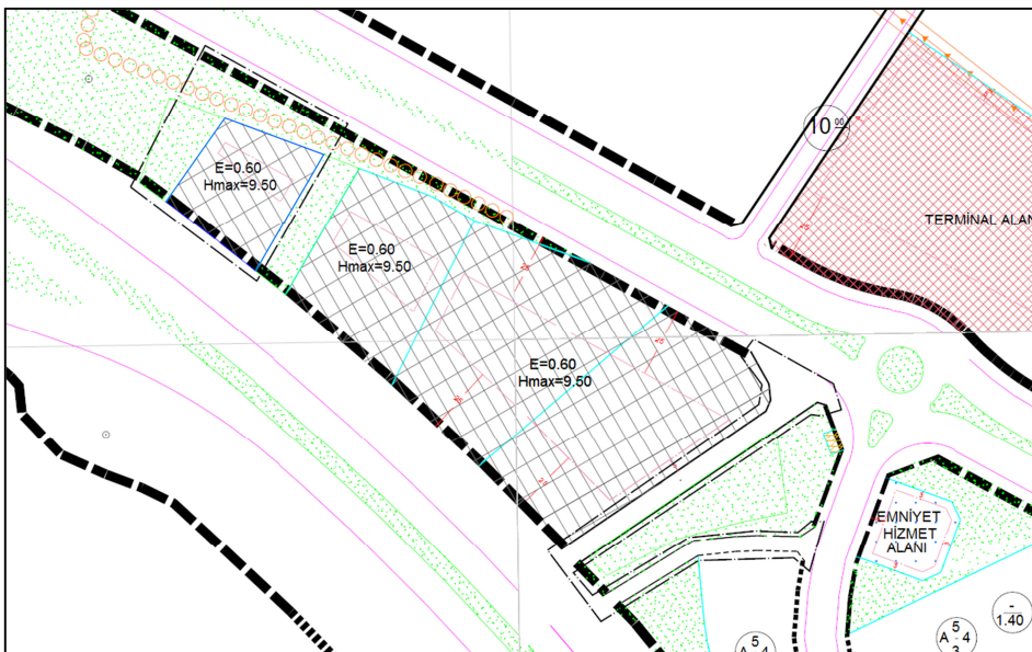
Resim 2: Onaylı 1/1000 Ölçekli Tatkovaklı Uygulama İmar Planı

Plan değişikliğine konu alan 1/1000 Ölçekli Tatkovaklı Uygulama İmar Planı'nda kısmen E:0.60, Hmax:9.50 m yapılaşma koşullu Konut Dışı Kentsel Çalışma Alanı'nda kısmen de Park Alanı'nda ve yaya yollarında kalmaktadır.